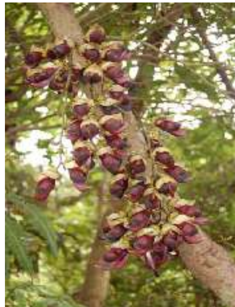
イルカンド (ウジルクカンド) マメ科 英名 Rusty-leaf Mucuna 沖縄各島に分布