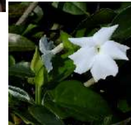
カオリカズラ キツネノマゴ科 インド～スリランカ原産