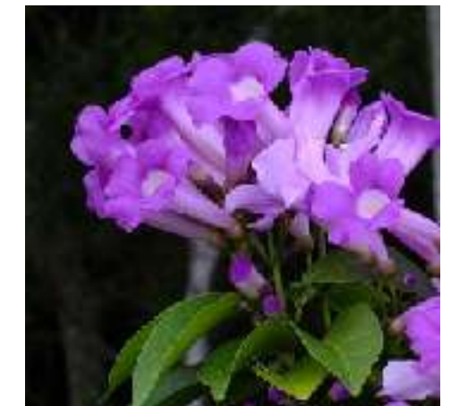
ニンニクカズラ ノウゼンカズラ科 別名 ガーリックカズラ 英名 Garlic Vine ギアナ～ブラジル原産