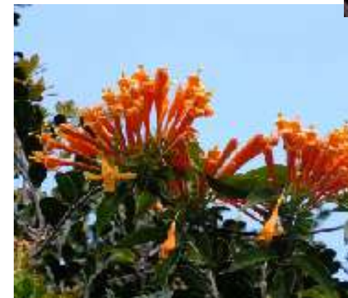
カエンカズラ ノウゼンカズラ科 英名 Flame Flower 中国名 砲伏藤 ブラジル南部、パラグアイ原産