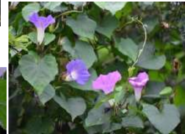
アサガオ ヒルガオ科 方言名 ヤマカンド、アミフカンド 英名 Blue dawn flower, morning-glory 熱帯アジア原産