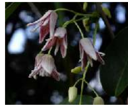
ムベ アケビ科 方言名 ヤマフトンミ 沖縄各島に分布