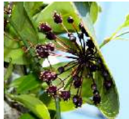
ササバサンキライ サルトノバラ科 方言名 サンキラ (石垣、西表) 奄美、沖縄、八重山に分布