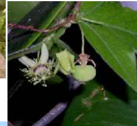
ミスミケイソウ トケイソウ科 南米原産 野生化