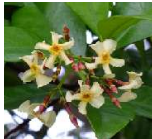
リュウキュウテイカカズラ キョウチクトウ科 沖縄各島に分布 ジャスミンに似た甘い香りがある