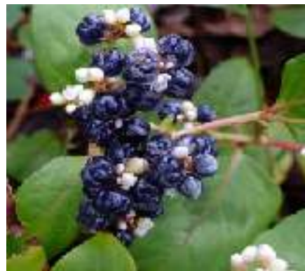
ツルソバ タデ科 沖縄各島に分布 方言名 シーバー、 シーバーウージャー (酸っぱいサトウキビ)