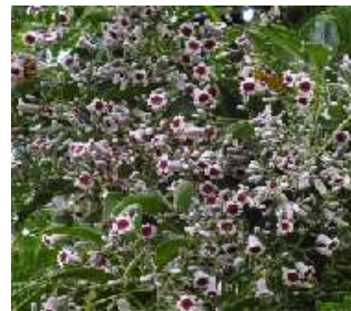
ヘクソカズラ アカネ科 別名 サオトメカズラ 沖縄の各島に分布