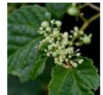
テリハノブドウ ブドウ科 方言名 ウブムスギ、ガニブ 各島