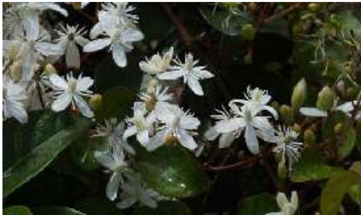
ヤンバルセンニンソウ キンポウゲ科 屋久島以南～南西諸島、中国、インドシナに分布

初夏の公園ではツル植物達の開花シーズンです。ヤンバルセンニンソウをはじめ、いろいろな種類がみられます。公園を散策する際には、ぜひ探してみてください。