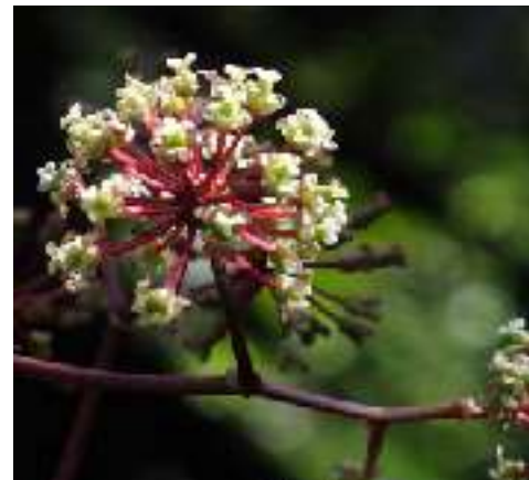
サツマサンキライ サルトノバラ科 各島に分布